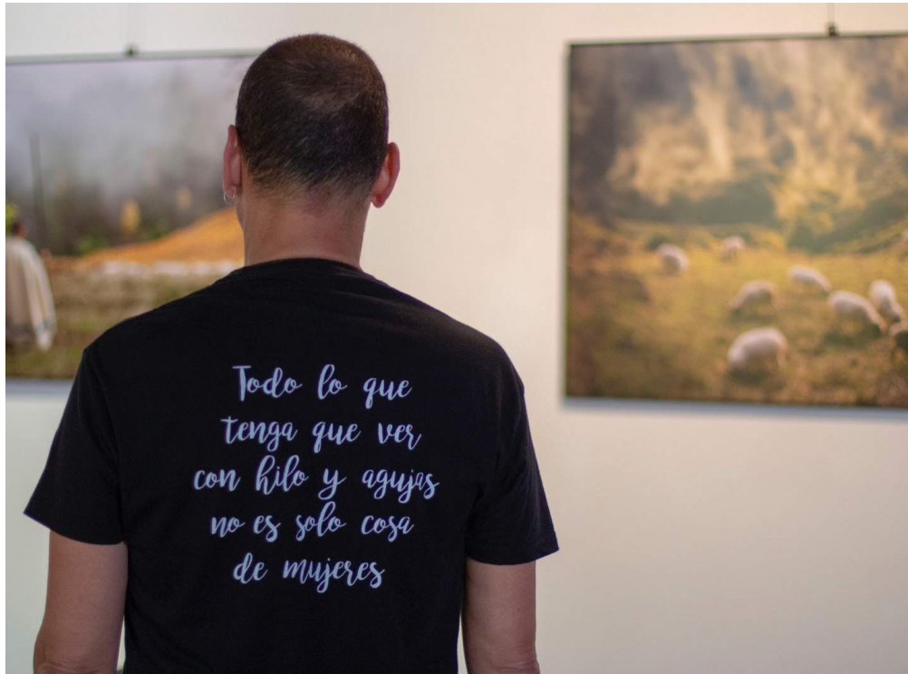
Plataforma de hombres tejedores.

Ayudamos a divulgar y a utilizar el uso de la lana como canal inclusivo , que no sepa de géneros ni de exclusiones. De la misma forma que damos a conocer otros usos y aprovechamientos de la lana, damos por hecho que estos usos no entienden ni de razas ni de religiones.