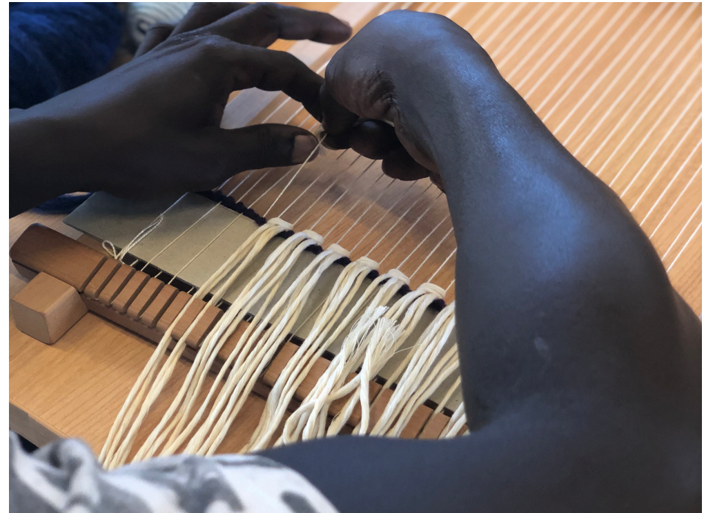
El uso de la lana como canal de integración desde la pluralidad y el respeto.